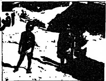
المطر ومشتغل في أفريقيا في كينيا طيب واحد لكل ٢٥ مواطن